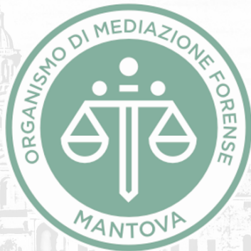
Tabella n. 1